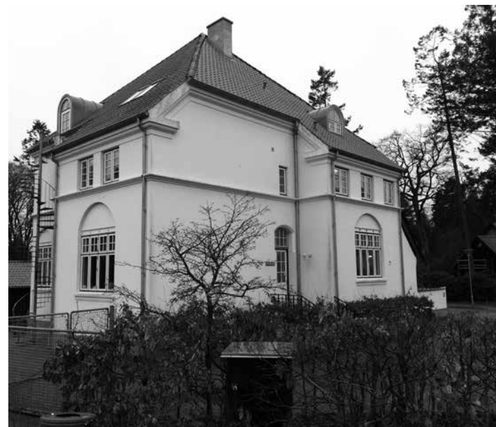
Februar 2015. Bygning i tilknytning til AQUA Akvarium & Dyrepark. Tidligere Afdeling Skovhuset, Vejlsøhus, hvor Carl og knap tyve andre mænd boede 1961 til 1986.

De 18 mænd flyttede ind i den tidligere overlægebolig, Skovhuset, på to-, tre- og firesengs stuer. Der var ikke meget plads, men forholdene var bedre end i Brejning.