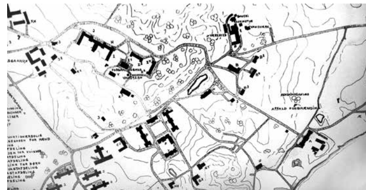
Væg billede på museet Kellers Minde af Den Kellerske Anstalt. Yderst til højre ses afdeling Æ1 og afdeling Æ2.

Den Kellerske Anstalt, Brejning var smukt placeret ned til Vejle Fjord. Den store anstalt var som en landsby.