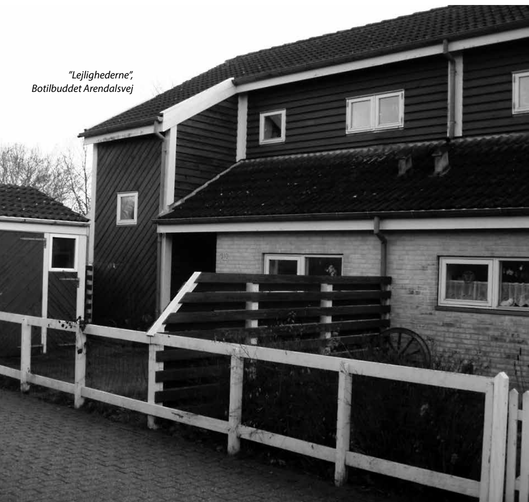
”Lejlighederne”, Botilbuddet Arendalsvej