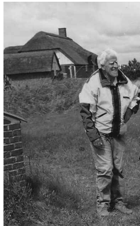
På ferie ved Vesterhavet.